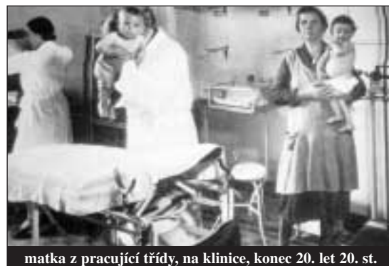
matka z pracující třídy, na klinice, konec 20. let 20. st.

ovanou sexuální zručnost s mužností fašistického systému. Samolibě se posmíval impotenci antifašismu za jeho státní formu označil republikánství a jeho hlavním příkladem byl současný největší nepřítel, demograficky slabá třetí francouzská republika. Do poloviny 20. let zůstala ikonografie squadristy věrná obrázku futuristy Maria Carliho z roku 1919. Se svými „horoucně hrdýma bezelstnýmá očima“ a „smyslňě energickými ústy připravenými vášnivě líbat, sladce zpívat a panovitě rozkazovat,“ byl tzv. fašista prvního období rozhodně svobodný muž; jeho „střízlivá elegance“ mu umožňovala být připraven na běh, boj, útek, tanec a vyburcování davu. 6 Mladí fašisté stále absolvovali své první sexuální zážitky v case