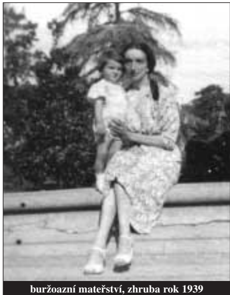
buržoazní mateřství, zhruba rok 1939

porodnosti. Stále živé iluze o možnosti hrát aktivní roli v novém pořádku zcela vyprchaly. Od okamžiku, kdy byly v letech 1927-28 ustaveny zvláštní tribunály k obžalobě antifašistů a kdy byl poprvé od vzniku moderního italského státu zaveden trest smrti, neexistoval prostor pro soucit a sentimentalitu, které Mussolini charakterizoval jako typický „ženský element... jehož pohlaví často vnáší do vážných věcí neodstranitelnou známku lehkomyšlnosti.“ 9 Mateřství ztratilo svůj speciální sociální význam, na který apelovaly téměř všechny italské feministky. Napříště se mateřství rovnalo fyzickému aktu rození dětí. Ženská plodnost nyní potencionálně definovala každý aspekt